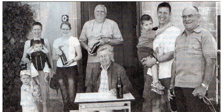
Le 14 juillet 2005, toujours autant de succès pour la 125 ème distribution